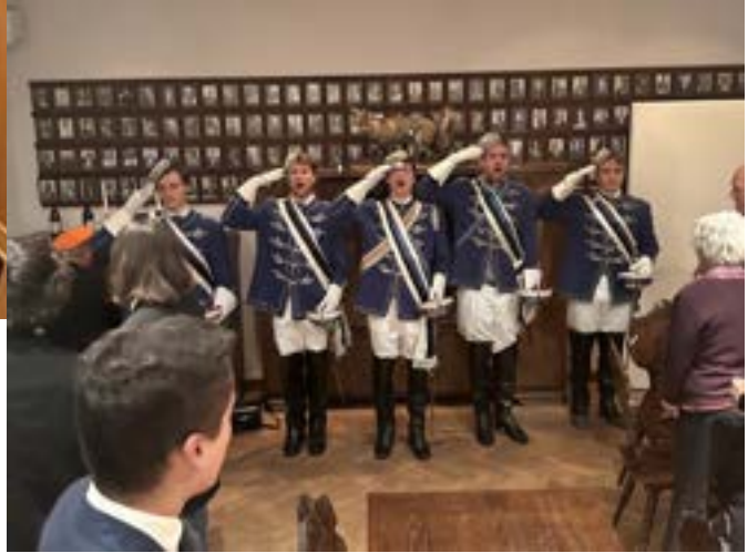
Nikofest WS 23/24